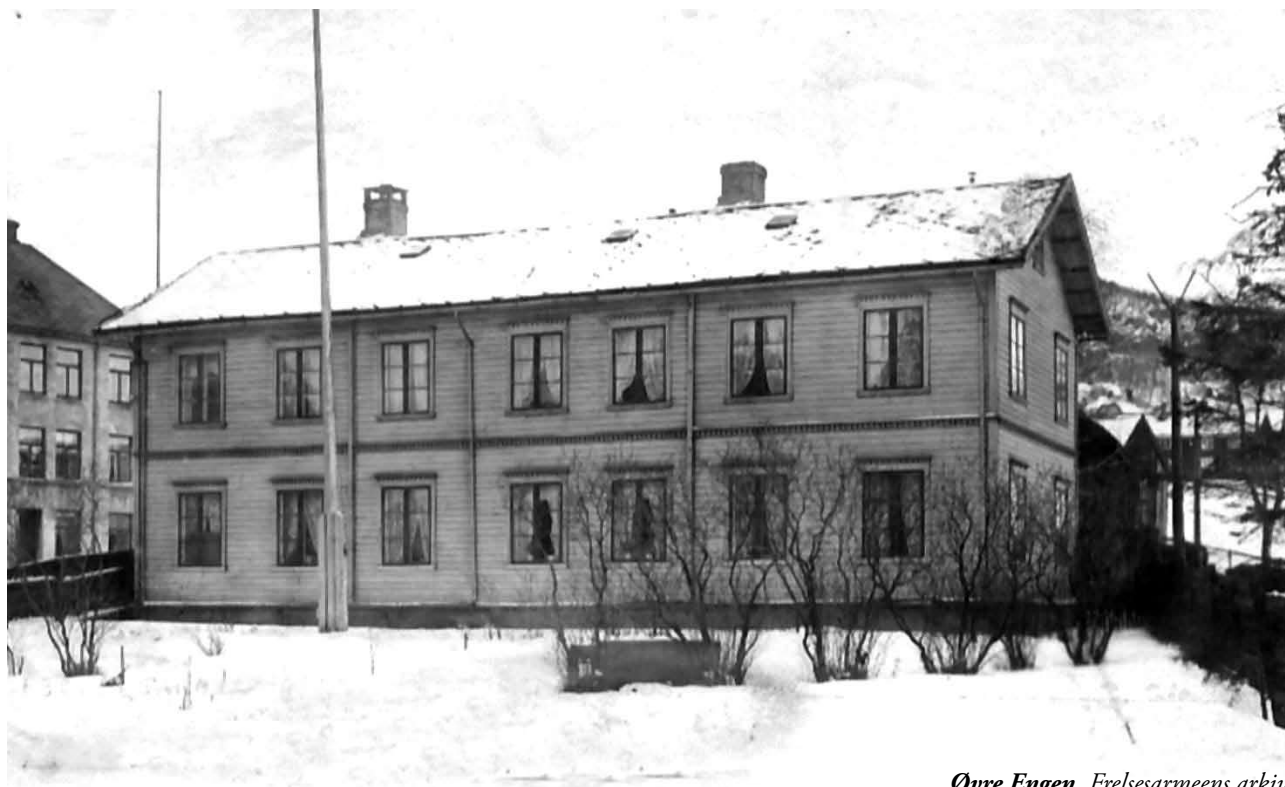
Øvre Engen.

”...de gråt med barna, og gledet seg med dem.” (Styrer 7 fra perioden 1976-1992)