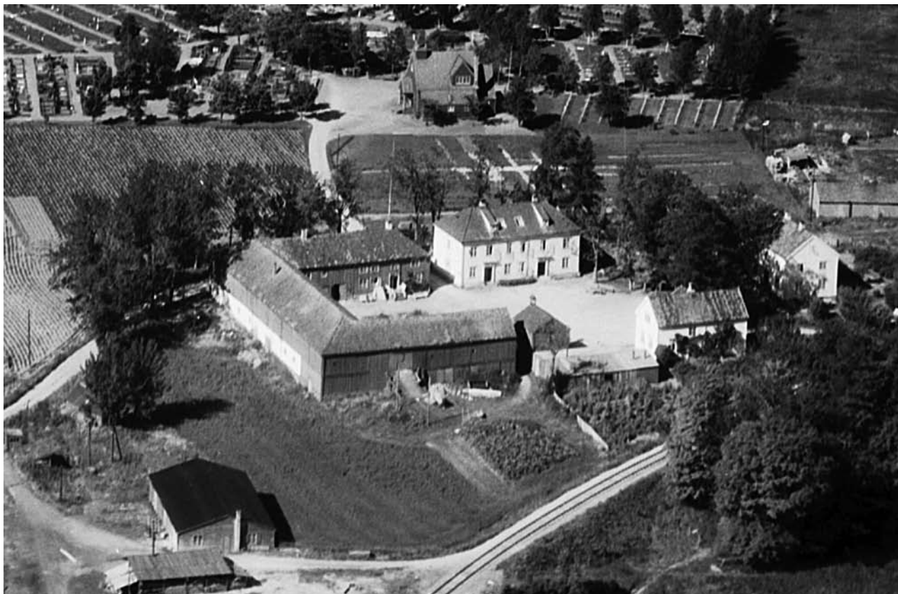
Stavne skole.