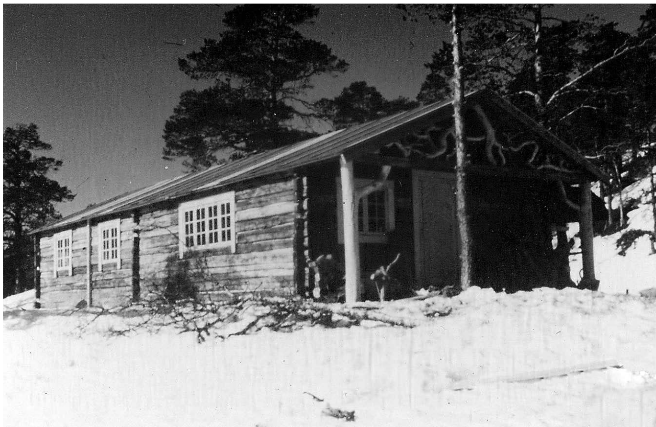
Gronnlia. Privat eie.

Også i denne perioden er det forklaringer om seksuelt misbruk av elever. Blant overgriperne var Vaktmesteren, eldre elever og en støttekontakt. De mindreårige guttene var i skolens varetekt, både i skoletid og fritid. Skolen hadde et selvstendig ansvar for alle elever, og i tillegg hadde barnevernet ansvar der omsorgen var overtatt fra foreldrene. Skolen med rektor i spissen pliktet selvfølgelig å hindre at ansatte forgrep seg på elevene. Men skolen skulle også beskytte elevene mot misbruk fra andre elever. Ved å vise barna tillit og fortrolighet, kunne de voksne i større grad mottatt betroelser om ubehagelige opplevelser. Kommunen har også et ansvar for at støttekontakter var skikket.