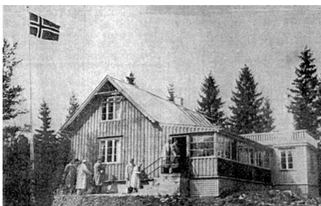
Knausen. Fra Frelsesarmeens blad Faklen.

Lykkebo, avdeling B, endret navn til Heggli. Årsrapporten for 1993 opplyser at man da hadde fem innskrevne barn, gutter på 9-12-13 år og jenter på 11-18 år. Det var en del problemer med rømning, utagering og slossing med personalet. Heggli er fortsatt i drift.