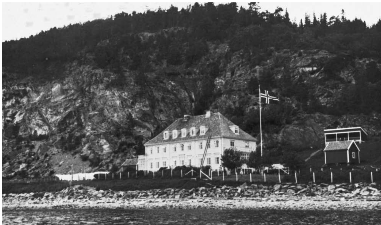
Kleivan barneheim./Kleivan off. skole. Postkort.

mere å leke med. Betjeningen er meget interessert i og hyggelige mot barna.”