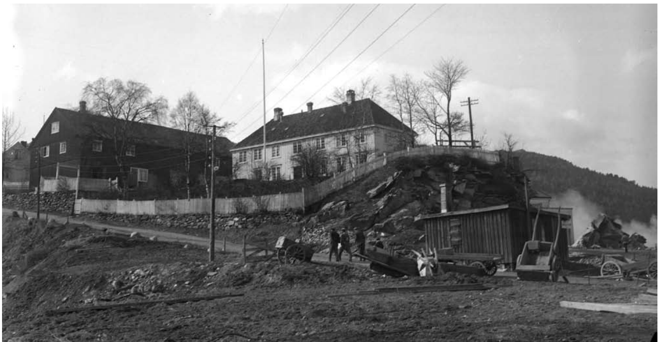
Trondheim Mor- og spedbarnshjem - Møllehaugen.

Granskingsutvalget har intervjuet 2 barn som bodde på