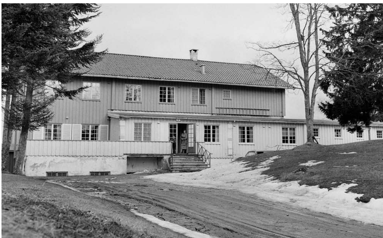
Finnes barnehjem.

”De gikk tur og hun holdt en av personalet i hånden. Da følte hun det som hun sugde til seg omsorg.” (Fem år gammel jente på 1970-tallet.)