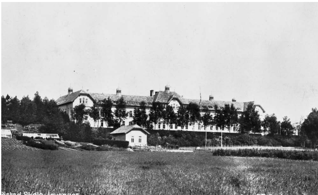
Røstad offentlige skole. Postkort. Foto Bjerkan. NTNU bibliotek - billedsamlingen.

tok da søsteren. De sparket og slo hodet hennes i gulvet. Hun fikk kul og blåflekker. Elevene ble også slått da de var på tur i fjellet. En gutt ble slått spesielt hardt. Tre av elevene stakk av og gikk nesten til Trondheim. De ble kjørt tilbake til Leira siste stykket, og de ble lovet at de ikke skulle få straff. De fikk imidlertid både ”ørtæver” med flat hånd og knyttneve og husarrest da de kom tilbake.