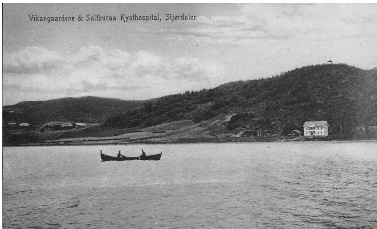
Saltburaa barnehjem/Kysthospital. Postkort.

var fint. Videre var det bra at jenter og gutter bodde i samme hjem. Og styresen grep alltid inn når hun ble klar over gale ting. Men de ansatte forstod nok ikke at overgrep skjedde.