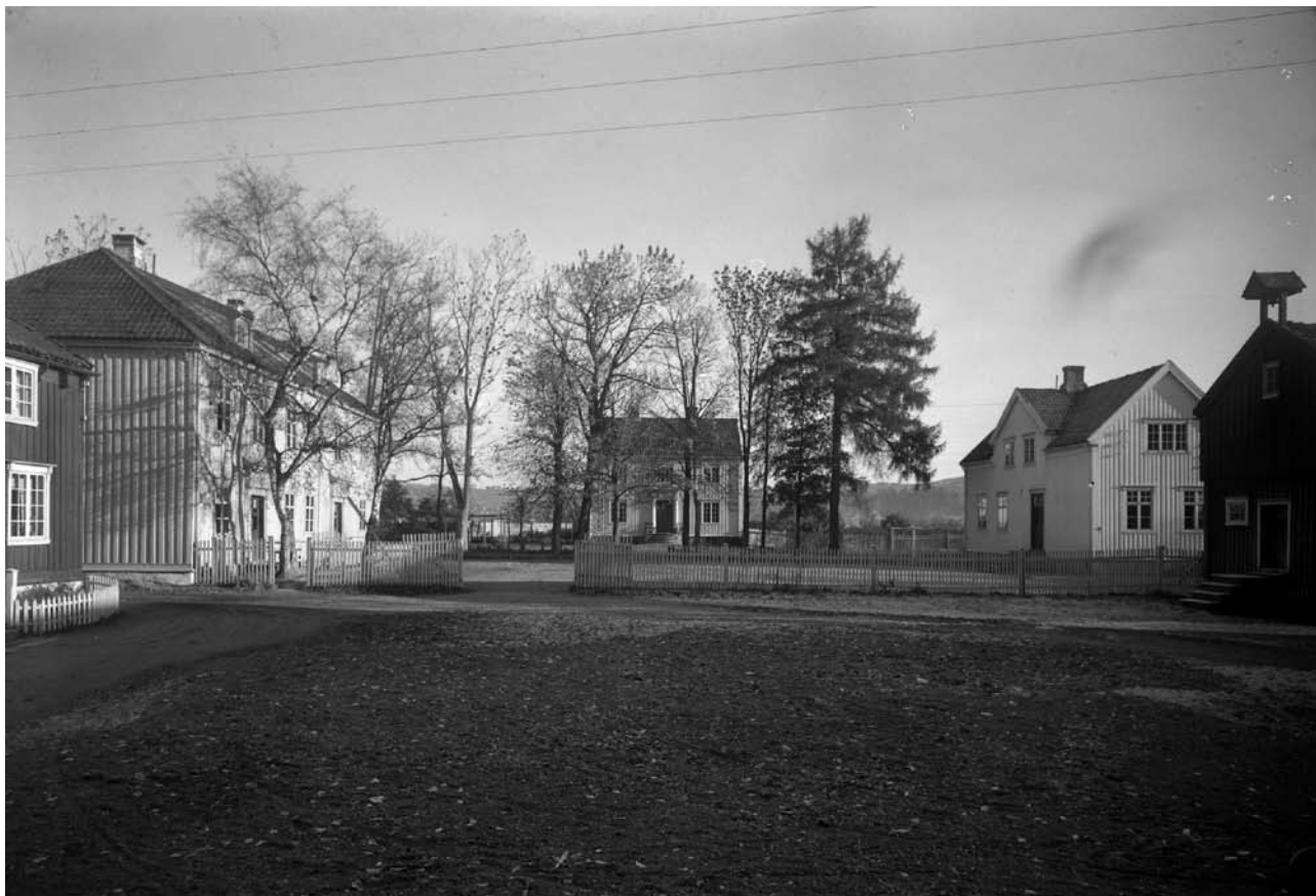
Øvre Stavne gårdsbruk og (tvangs) skole.

”All hans berøring medførte smerte.” (Elev om Vaktmesteren)