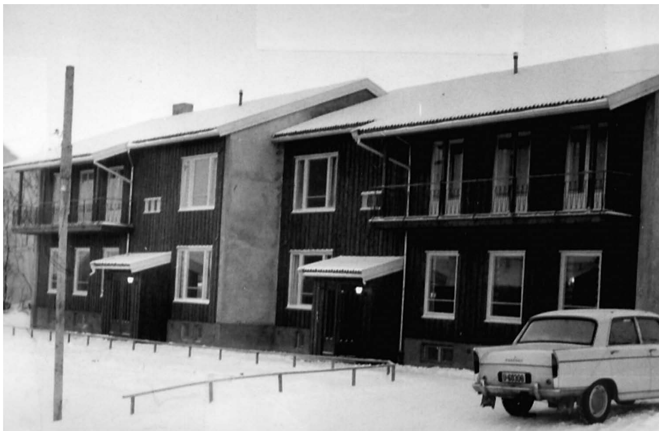
Lykkebo, Øystein Møylas vei.

Det er ikke fremkommet opplysninger som tyder på at de ansatte har begått seksuelle overgrep overfor barna. Uttalelsene mot slektningen til styrer 2 er for vage til at det kan trekkes konklusjoner. Men flere har fortalt om misbruk mellom barna, fortrinnsvis ved at større barn har vært pågående mot de mindre. Utvalget har spesielt merket seg gutten som gjennom et par år ble seksuelt misbrukt av den eldre gutten han delte rom med rundt 1970. Det ser ut til å ha skjedd uten at noen ansatte har sett eller skjønt det. Tatt i betraktning at misbruket varte så lenge, må det reises spørsmål om de ansatte holdt godt nok tilsyn med disse guttene.