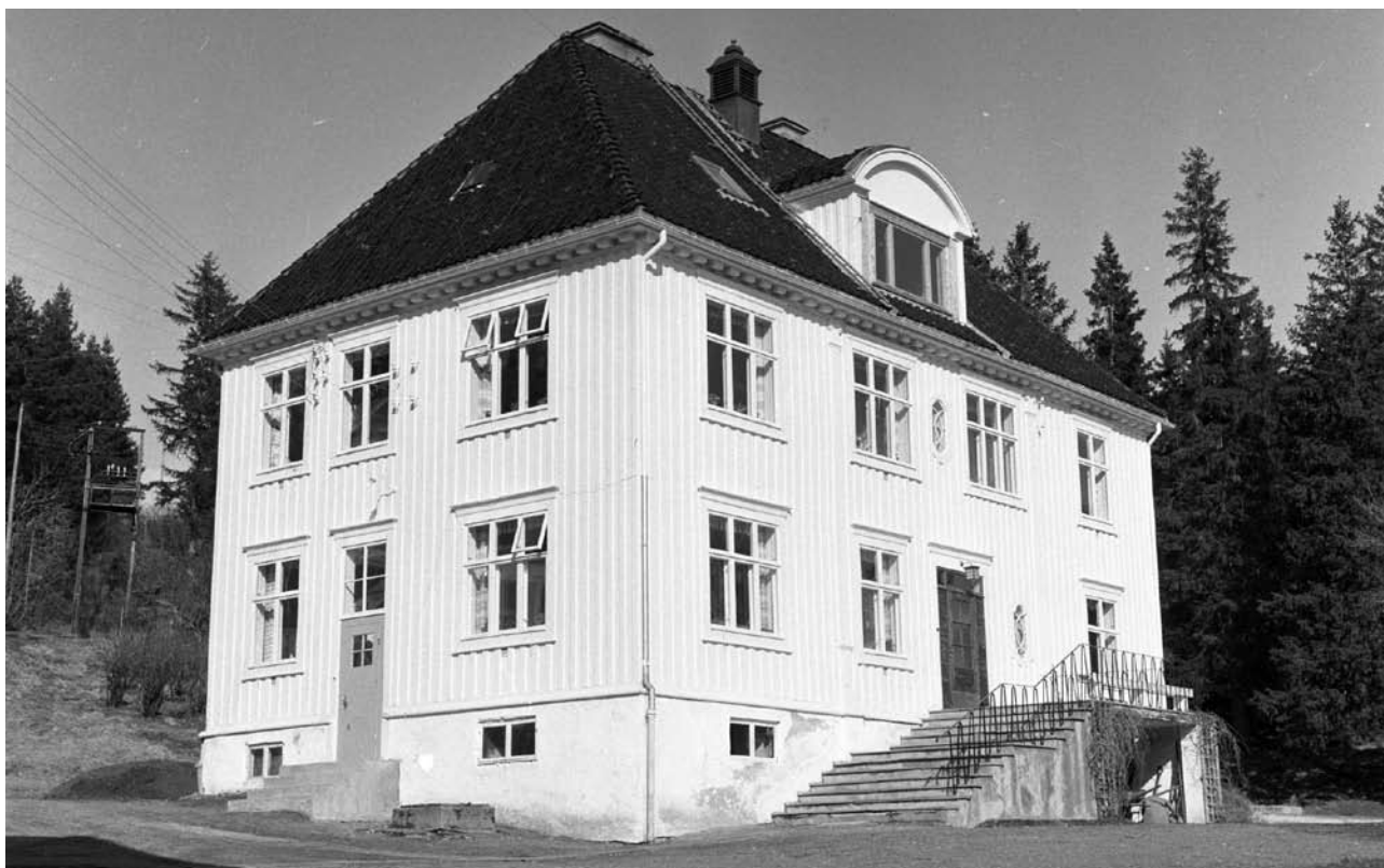
Nylønne barnehjem/tuberkulosesanatorium for barn.