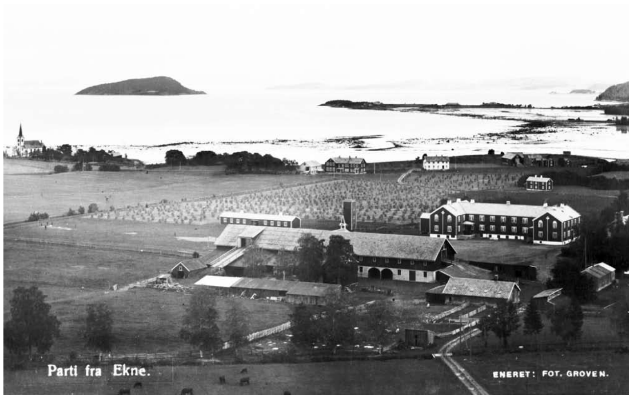
Ekne offentlige skole. Postkort.

virkeligheten”. Hyggelig kan det ikke ha vært på Falstad, skriver Ustvedt, for det fantes ikke dagligstuer og oppholdsrom der, bare klasserom. Noen gymnastikksal var det heller ikke. Som i de andre skolehjemmene, besto det meste av virksomheten på Falstad av gårds- og skogsarbeid.