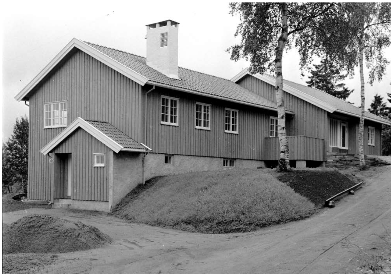
Møllebakken ungdomspensjonat/Møllebakken ungdomshjem.

men på den annen side en nødvendig pris hvis driften med fullt belegg skulle bære seg noenlunde. Den høye prisen var årsaken til det lave belegget. Det heter videre i rapporten, at man på grunn av hybelnøden i byen hadde leid ut to hybler høsten 1961, uten noen som helst underbringelse. Utleien skjedde til to studenter og med kr 80 pr måned i leie.