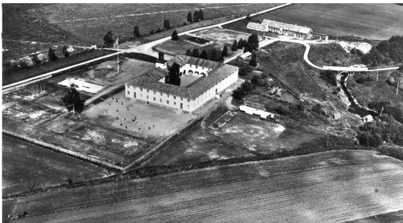
Ekne offentlige skole.

Ustvedt (2000) skriver om den forfalne gården Nedre Falstad på Ekne i Nord-Trøndelag. Der var det fra 1895 oppdragelsesanstalt for ”50 vanartede gutter fra Trondheimsområdet”. Falstad lå like ved allfarveien, så å si midt i bygda. Det var ikke ønskelig å isolere guttene på en øy og på den måten gi dem skolehjemstempel. Derimot ville man ”innforlive skolen i samfunnet og