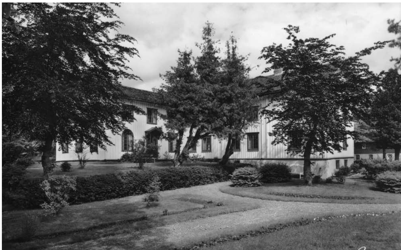
Rostad Barneheim/Rostad Ungdomsheim.